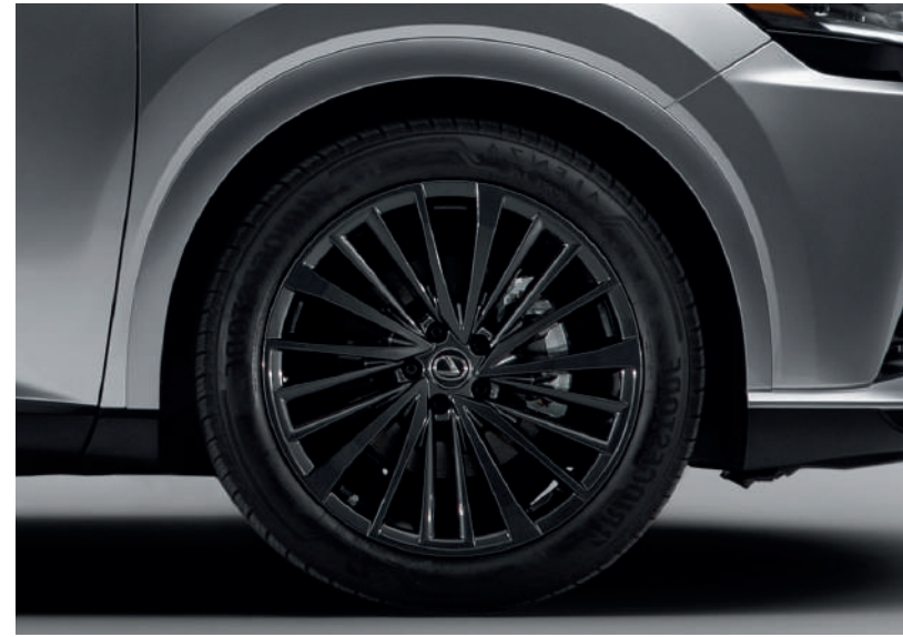
Дизайн F Sport, F Sport+