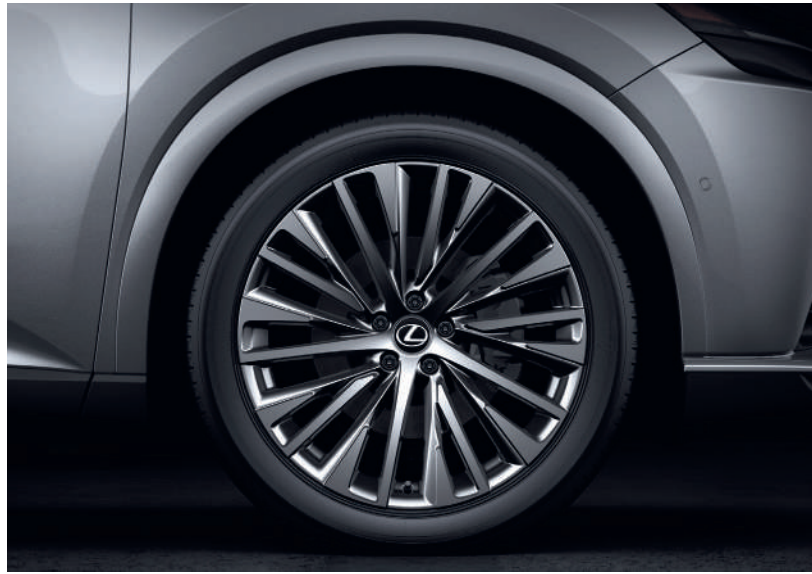
Дизайн 2 (Luxury)