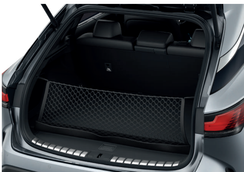
Вертикальна сітка кріплення багажу