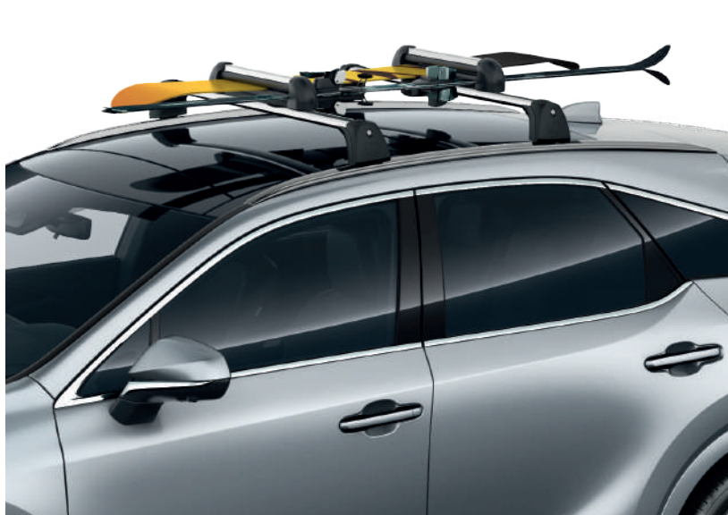
Кріплення для лиж та сноуборду