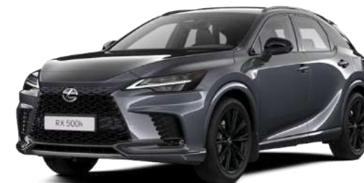
111, Хромовий сірий