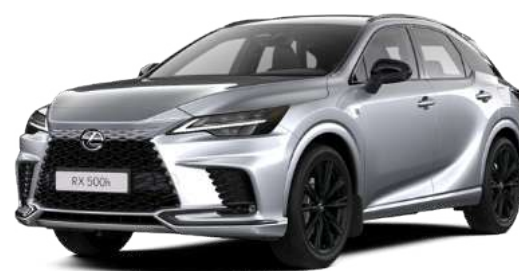
112, Платиновий сірий