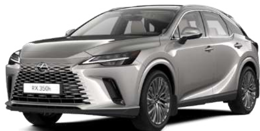
117, Титановий сірий*