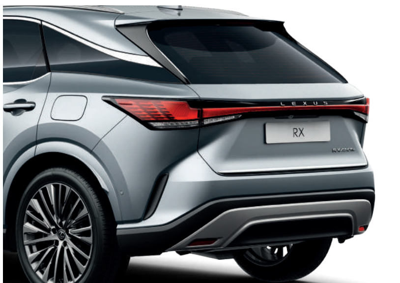
Декоративна накладка кришки багажника