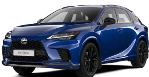
8X1, Синій сапфір**