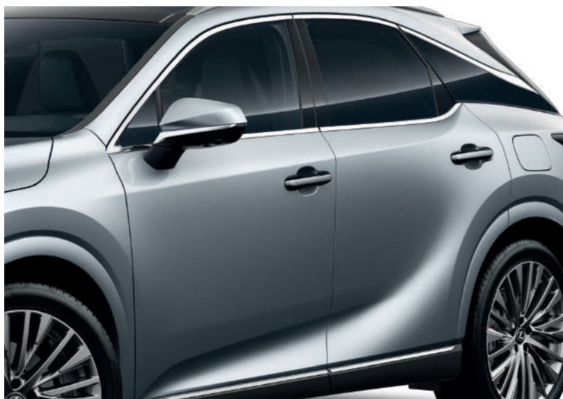
Молдинги дверей хромовані