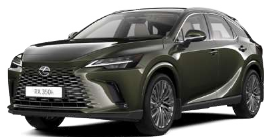
6X4, Терейн хакі*