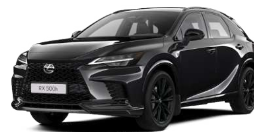
223, Чорний графіт