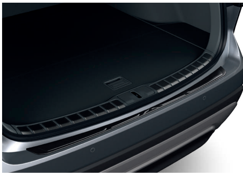
Захисна накладка багажника