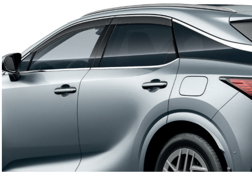
Дефлектор вікон з хромованим окантуванням