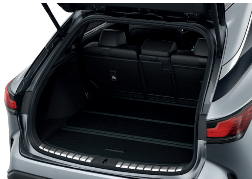
Гумовий килимок багажника