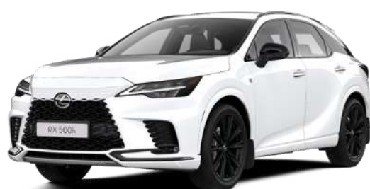
083, Білий F sport**